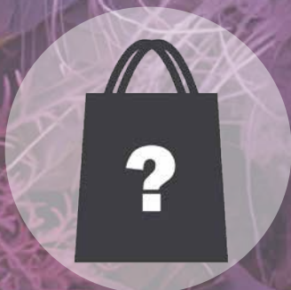
Mystery Bag $300