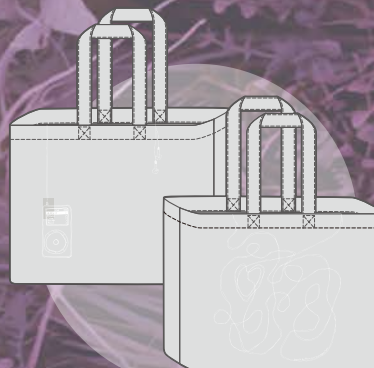
Giant Tote Bag $290