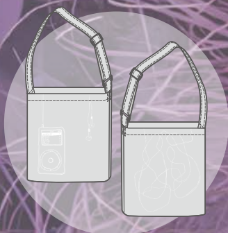
Crossbody Bag $220