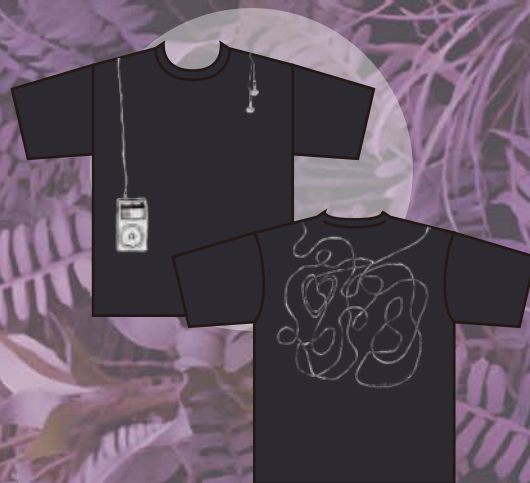
Black Tee $320